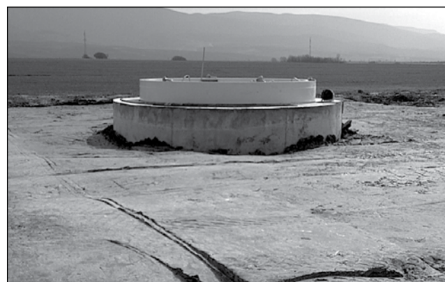
O eoliană ocupă jumătate de hectar de teren

1 MW solar = investiție de 3 milioane euro, pe 2-3 ha