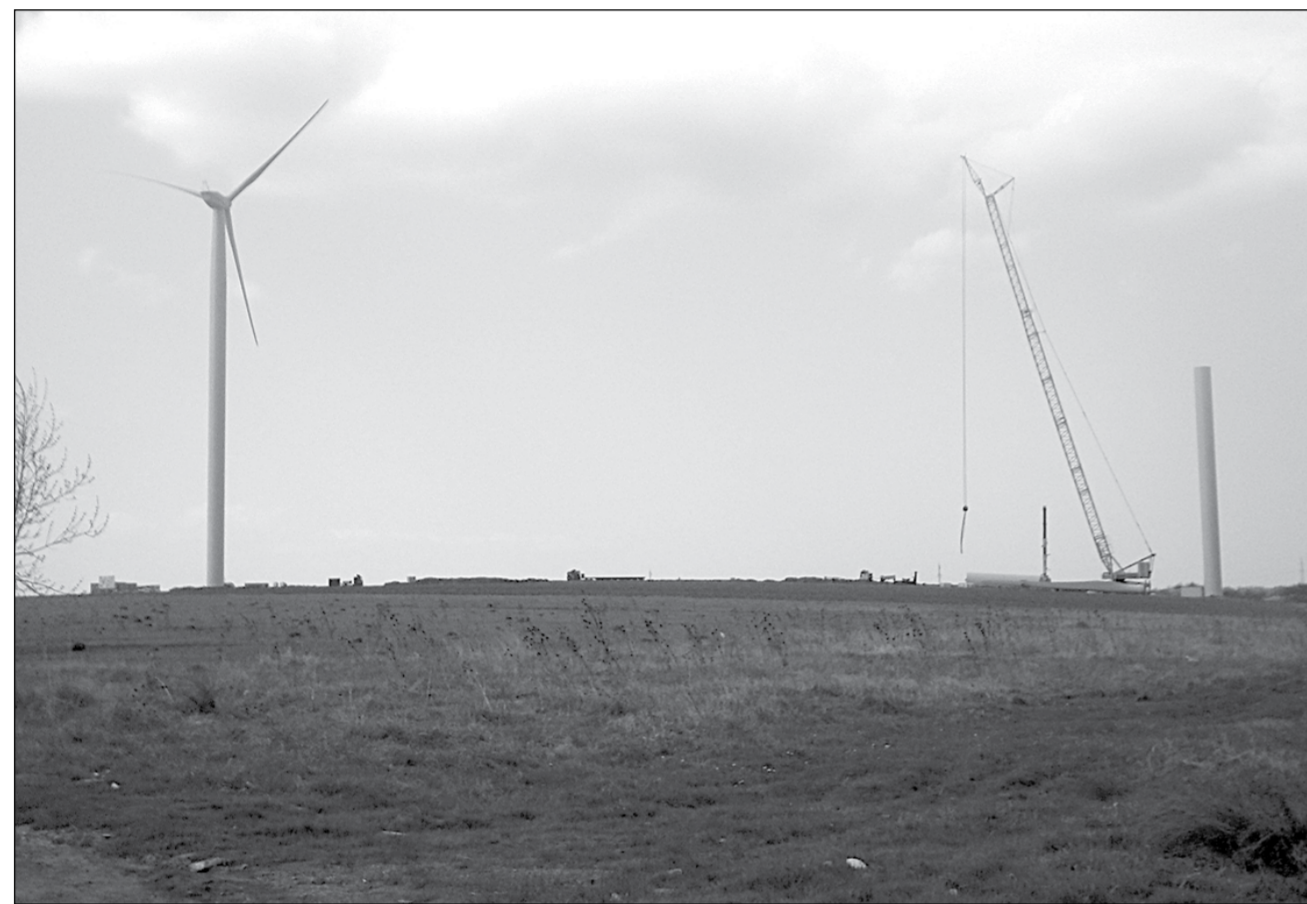
La Oravița se montează primele turbine eoliene

Interes sau dezinteres? Omul de afaceri timișorean Lucian Perescu este unul dintre cei care a ales să investească în „energie verde” din Caraș-Severin. În această perioadă se fac procedurile pentru montarea primelor 6 eoliene la Oravița având o putere de 1,5 MW. Vor urma alte 7 turbine de 2,5 MW și o investiție