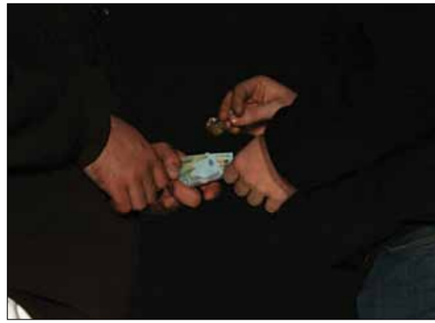
Banii și „iarba” trec dintr-o mână în alta