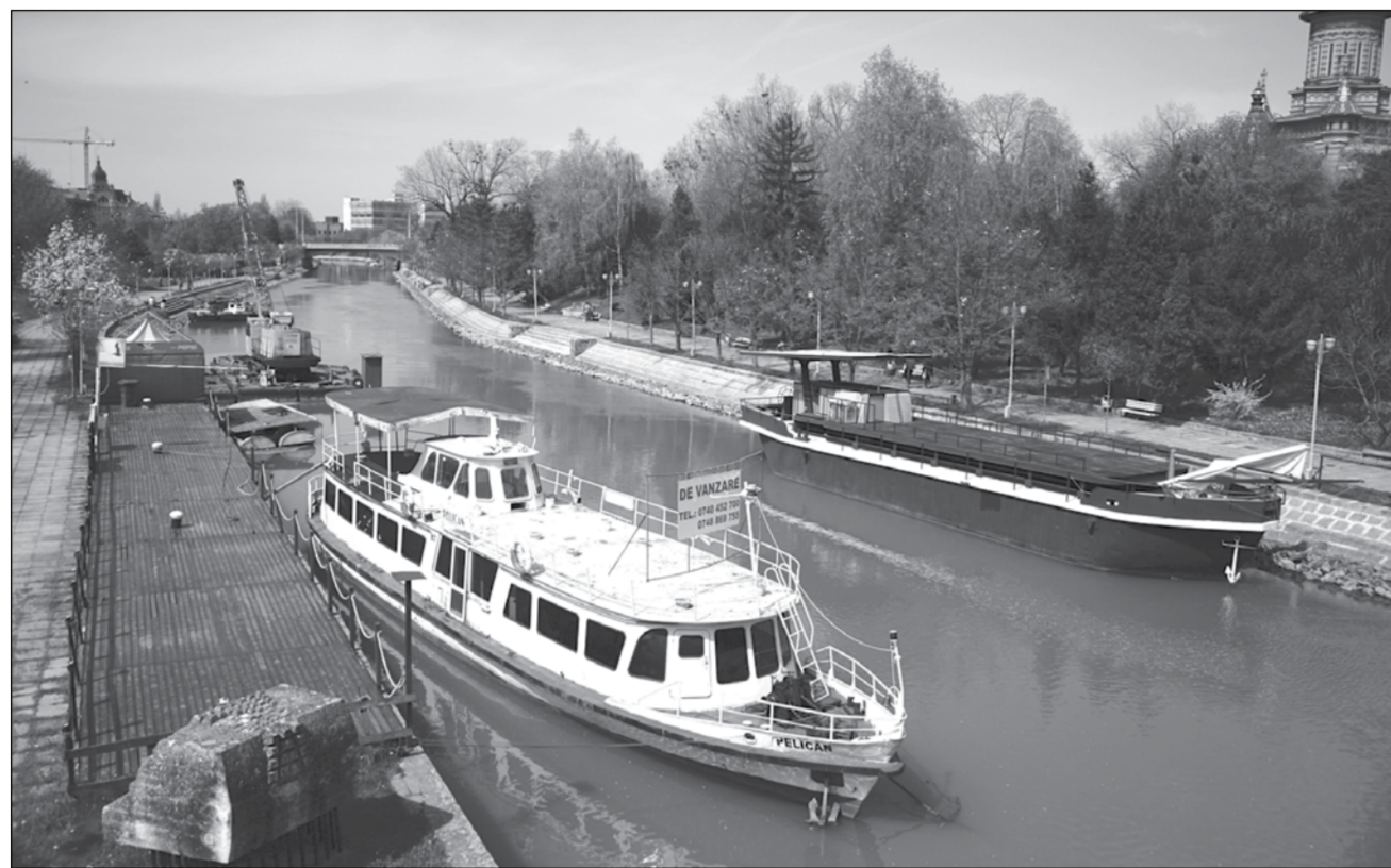
În curând, transportul în comun se extinde și pe Canalul Bega

ROXANA DEACONESCU roxana.deaconescu@opiniatimisoarei.ro