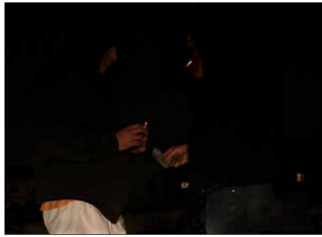
Dealerul se întâlnește cu cumpărătorul