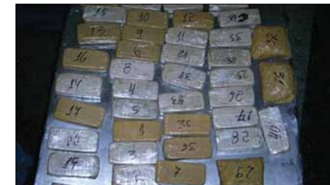
Cea mai mare cantitate de droguri confiscată de polițiștii timișoreni a fost de peste 40 de kilograme