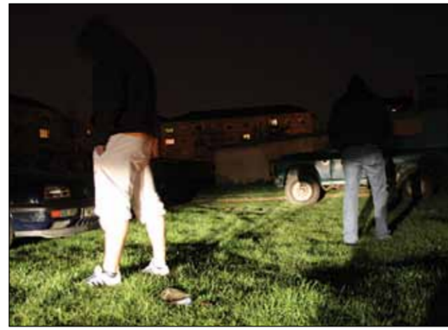
După tranzacție, cei doi își continuă fiecare drumul