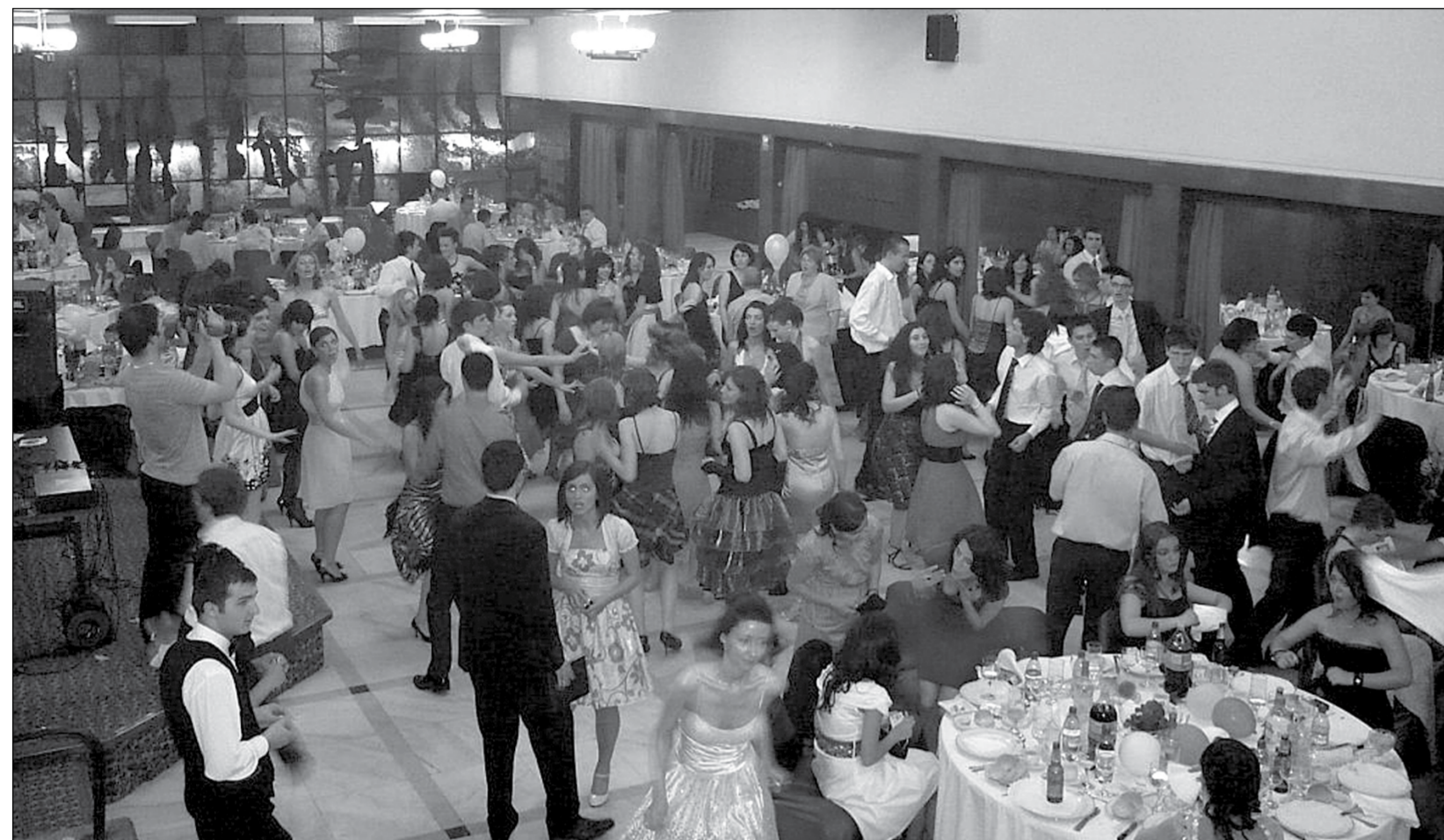
Pentru petrecerea de sfârșitul clasei a XII-a, părinții elevilor plătesc sute „bune” de lei