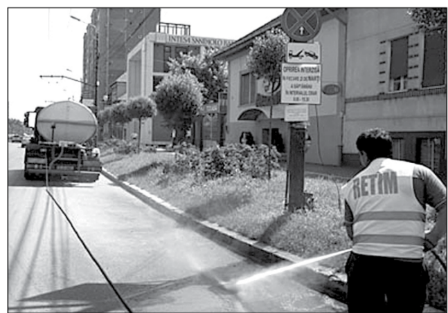
Primăria va reincepe spălarea străzilor, în speranța că praful din Timișoara va dispărea

„În viitorul apropiat o să ne vină și două utilaje pentru RETIM, care, tehnic, să poată spăla străzile și pe sub mașini, pentru a nu mai fi