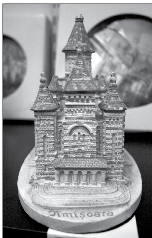
Suvenirurile legate de Timișoara sunt puține și greu de găsit în magazine

mite cadou din toate orașele lumii. Are mini sticlute de whiskey din Statele Unite, instrumente muzicale din Italia sau Austria, cutiute muzicale din China și, bineînțeles, mini-tauri din coridele spaniole și un breloc extrem de chic cu orașul Nimes din Franța. Toate le-a adunat de-a lungul anilor și este oarecum dezamăgit de faptul că nu poate în Timișoara să găsească colecția cu creații autentice. „Eu am încercat câteva acțiuni cu mai mulți studenți de la arte. Am încercat să facem câteva machete cu halba de bere, însă s-au oprit doar la câteva exemplare. Problema