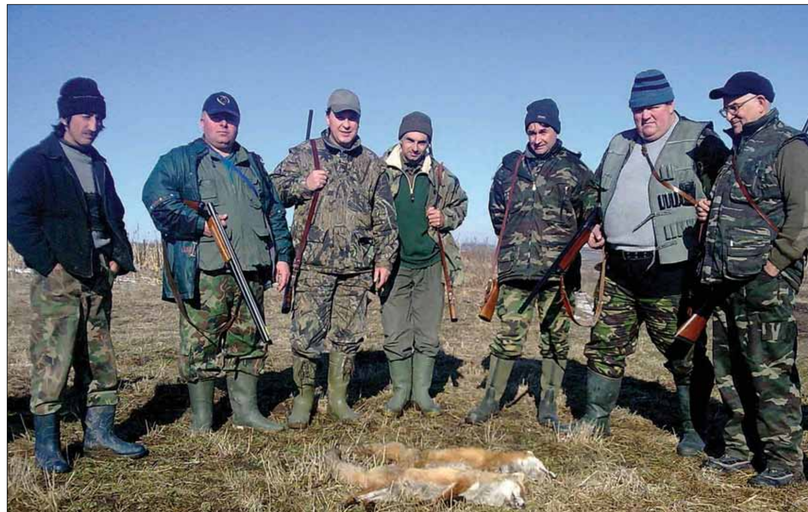
Străinii sunt interesați să vâneze la noi în județ, iar pentru asta plătesc sume destul de semnificative

„Noi avem acum 33 de fonduri de vânătoare și nu avem voie, conform legii,