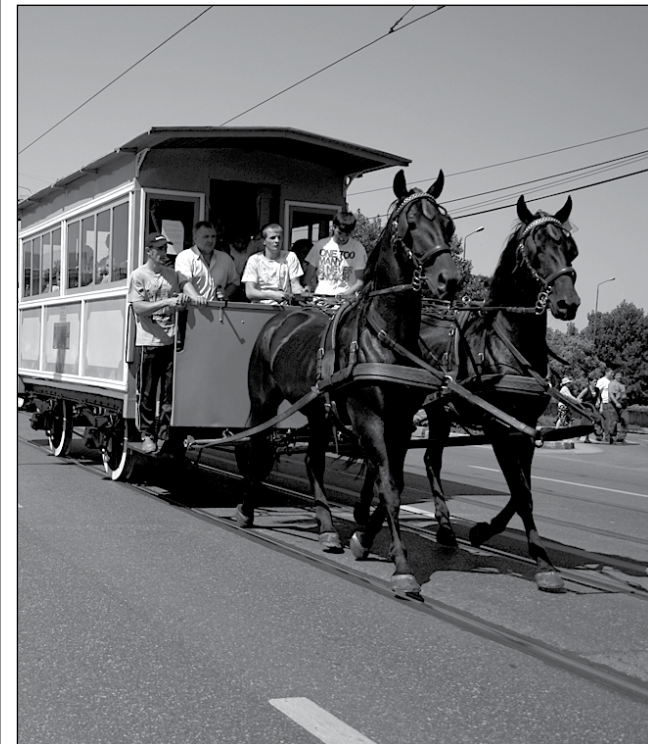
Primul tramvai tras de cai din Europa a circulat la Timișoara

Timișoara, orașul regiunii cu 1001 de premiere!