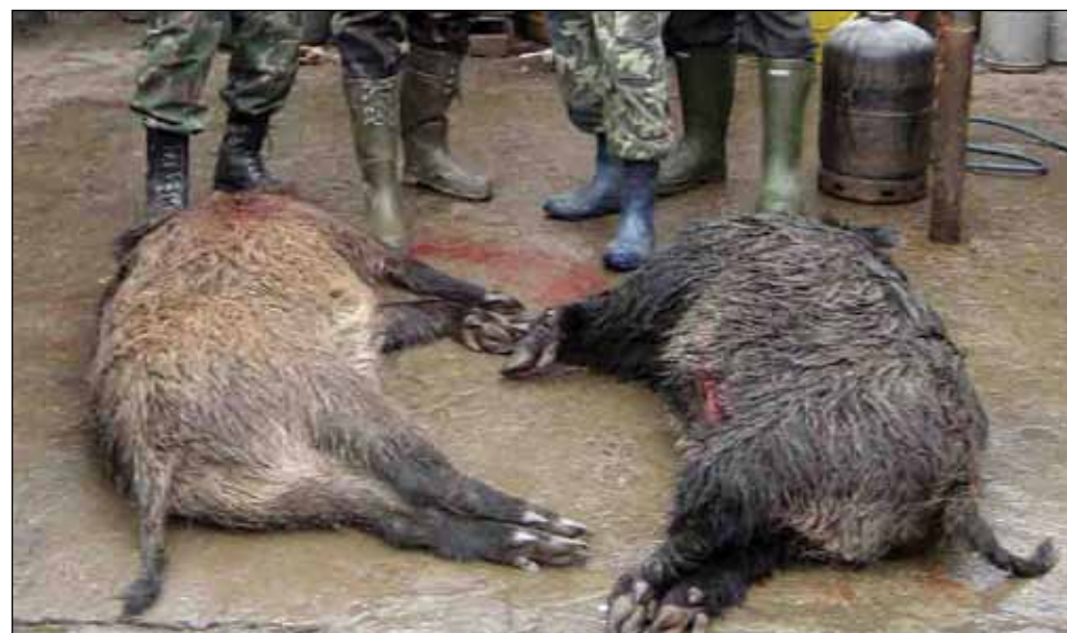
Pentru un porc mistreț sumele sunt cuprinse între 200 și 1.000 de euro

„Trebuie să se pună la punct cu ceea ce înseamnă proprietatea și a pierderilor care rezultă în urma acestor fonduri de vânătoare. 500.000 de hectare de teren