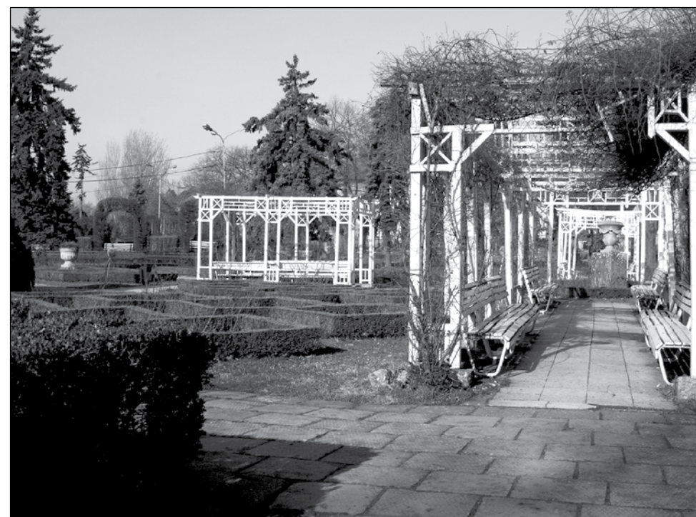
În Parcul Rozelor vor fi plantați peste 900 de soiuri de trandafiri

Firmele care au câștigat licitația vor începe să schimbe aleile, apoi vor lucra la înfățișarea parcului, mai spune edilul. „O parte din trandafirii pe