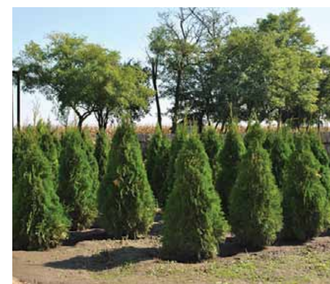
Prețurile sunt diferite în funcție de mărimea arbuștilor