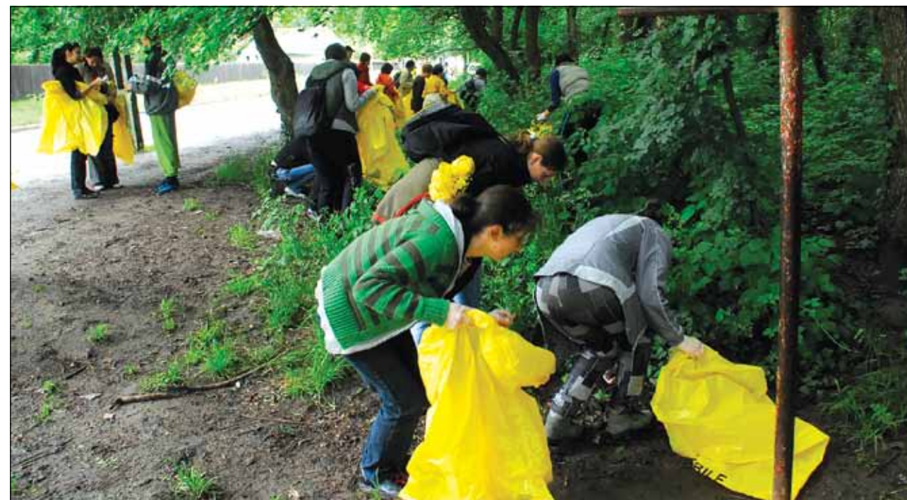
Mii de voluntari se înscriu la cea mai mare campanie de curățenie din țară

■ „Let's Do It, România!” angrenează mii de români în campania națională de curățenie care se va desfășura în 24 septembrie