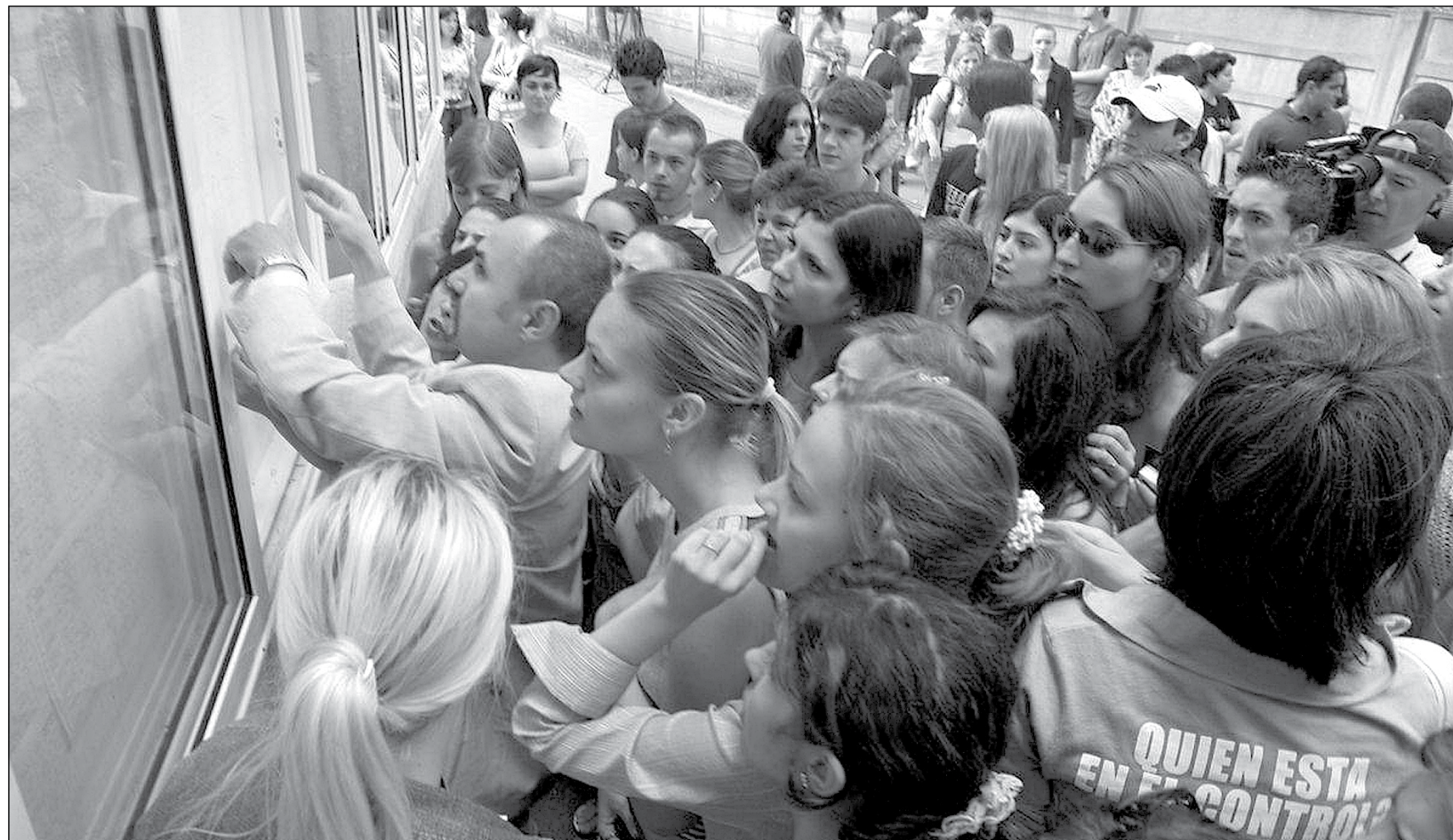
După intrarea în plată, absolvenții de liceu, cu sau fără bac, primesc timp de un semestru, la care se pot adăuga alte trei luni, o indemnizație lunară de 255 de lei

Doar 20% dintre cei peste 3.500 de absolvenți care au „picat” Bac-ul și-au depus dosarul la Inspectoratul Teritorial de Muncă pentru a primi ajutor de șomaj