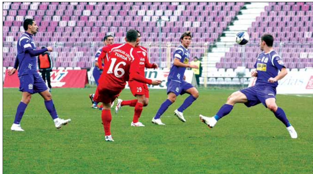
Timișoreni încă joacă în liga a doua, dar nu se știe pentru cât timp...

reușit să-l tot amâne, dar nu se știe până când. Aici lăncu nu a achitat niciun ban celor de la Sporting Lisabona, ba chiar ar agreea o renunțare a colaborării cu fotbalistul de la Poli numai să i se taie datoria către clubul lusitan. Acestea sunt doar două din problemele cu care se confruntă finanțatorul de pe Bega.