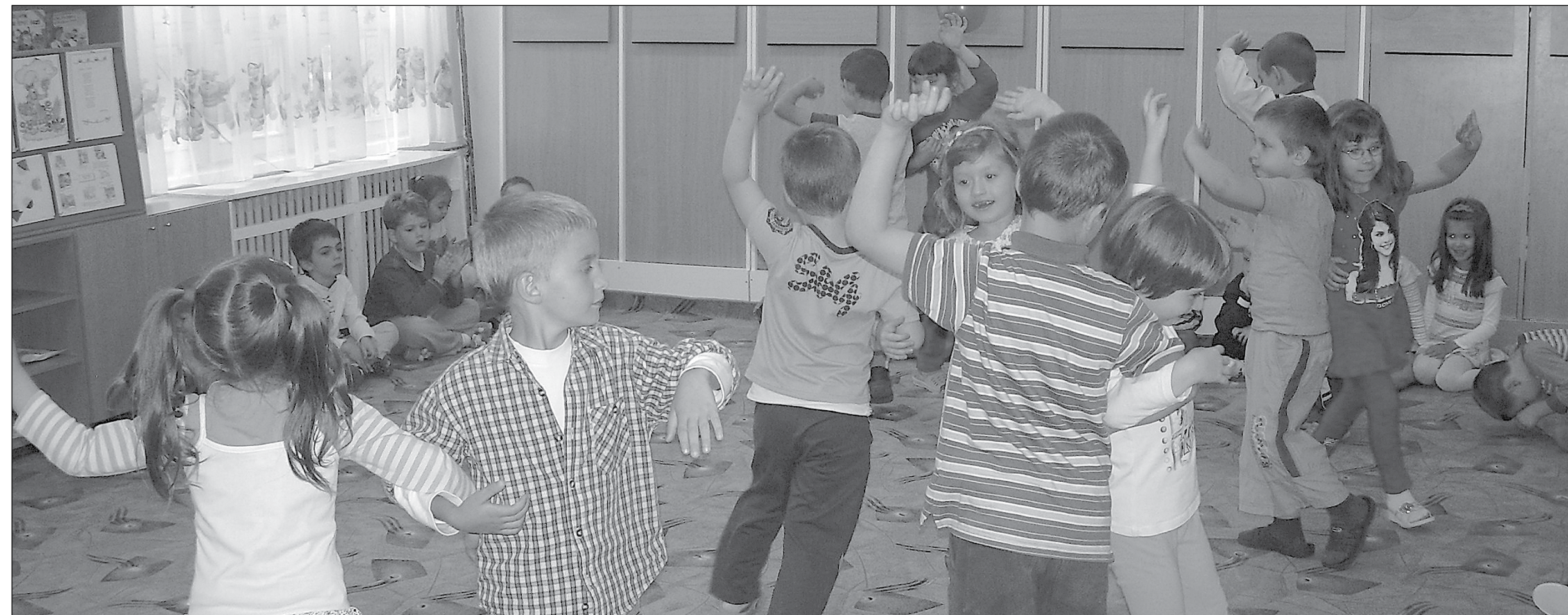
Prichindeii de grădiniță vor merge la școală obligatoriu de la vârsta de 6 ani