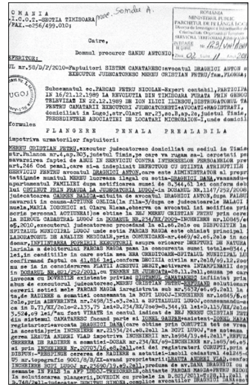
Documente din dosarul de cămătărie