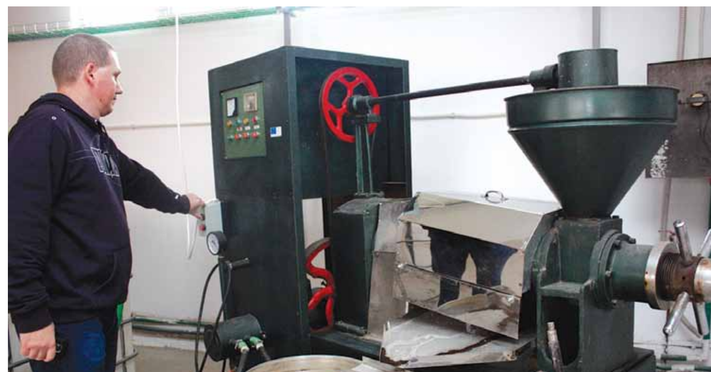
Instalația de biodiesel poate determina independența energetică a Universității de Științe Agricole și Medicină Veterinară a Banatului

Trei aspecte urmăresc universitarii agronomi timișoreni. În primul rând, instalația nu a fost concepută pentru a crea biodiesel la nivel industrial. Acest lucru înseamnă că se poate obține o cantitate suficientă pentru a-i oferi USAB-ului independența energetică.