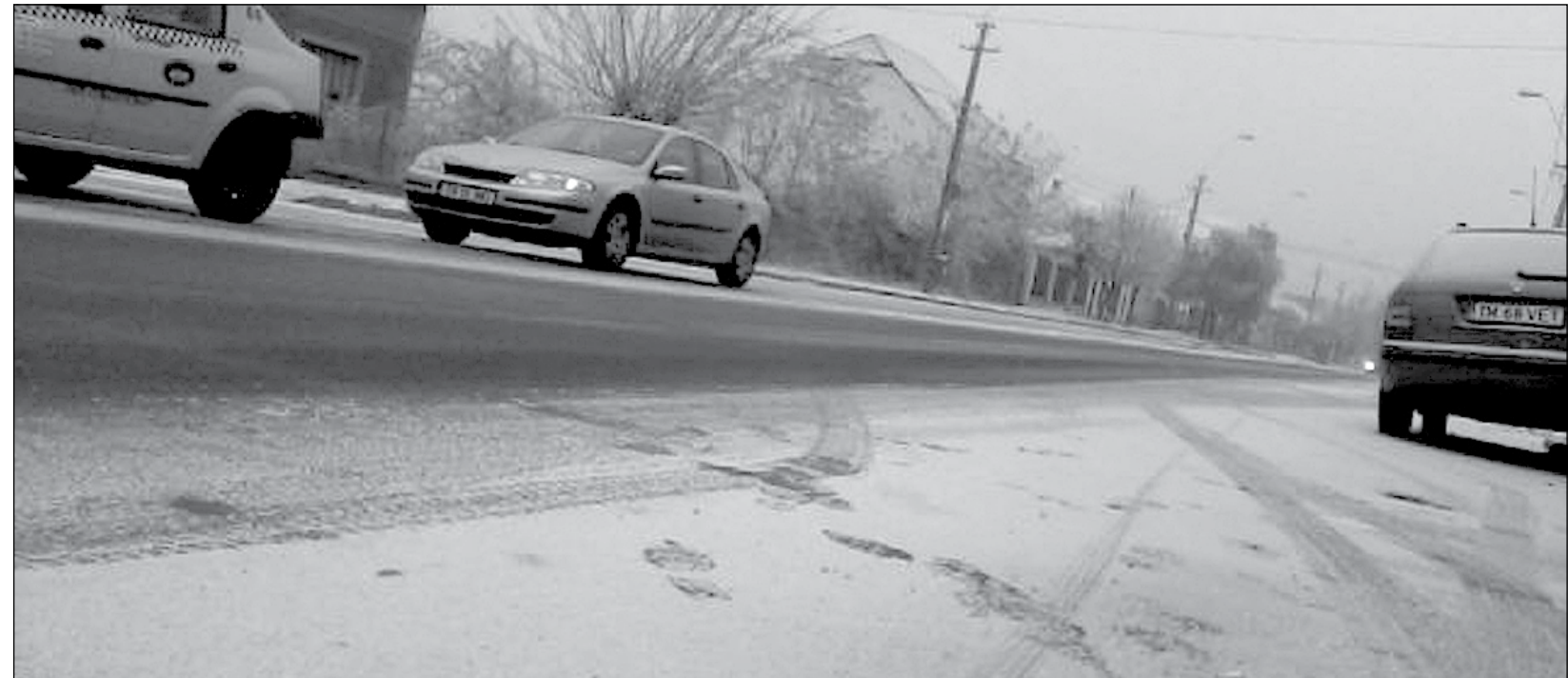
După ce a apărut zăpada pe șosele, numărul celor care au mers la service-uri și vulcanizări s-a triplat

■ Polițiștii nu au dat deocamdată amenzi celor care nu și-au echipat mașinile