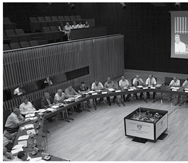
În urma ultimei rectificări bugetare CJT finanțează baschetul

Echipele de baschet ale Timișoarei, cea de băieți și cea de fete, vor fi susținute cu sume substanțiale de către Consiliul Județean Timiș, au decis consilierii județeni din Comisia Economică a CJT. Proiectul urmează să intre în plenum CJT, la sfâr-