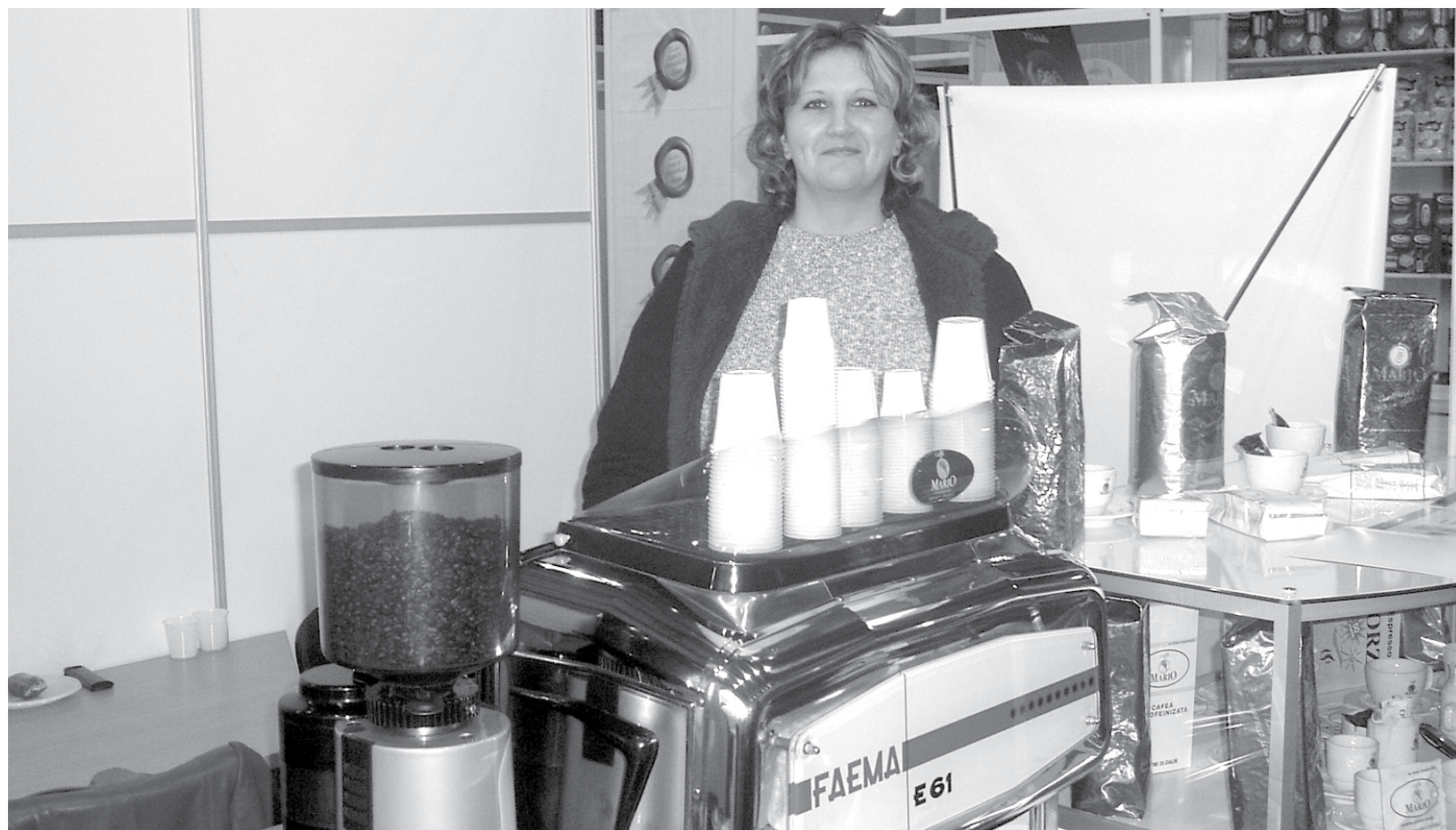
Aparatele de cafea sunt puse la dispoziție gratuit de „Mario” celor interesați

■ O rețetă de succes: aparate profesionale și cafea proaspătă